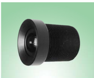
专用高分辨率镜头